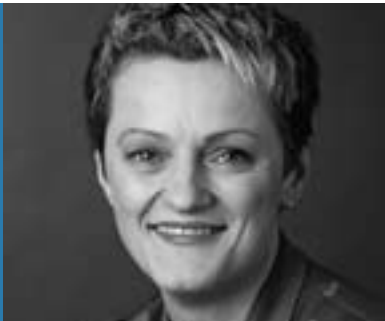
Renate Künast Fraktionsvorsitzende, Bündnis 90/Die Grünen

Welche Visionen haben wir für die politische Kommunikation von Morgen?