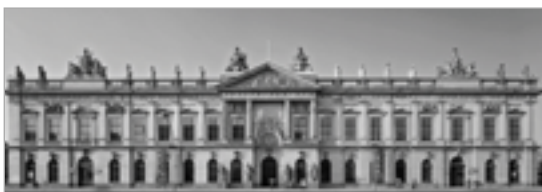
Das Deutsche Historische Museum: Veranstaltungsort des Politikaward.

Der Politikaward ist die renommierteste Auszeichnung für Arbeiten aus dem Bereich der politischen Kommunikation. Im Rahmen einer glanzvollen Gala ehrt der Preis die herausragendsten Kampagnen, die erfolgreichsten Akteure und zukunftsweisende Arbeiten der Branche. Durch den Abends führt der NDR- und radioeins-Moderator Steffen Hallaschka.