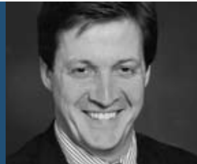
Alastair Campbell Ex-Regierungssprecher und -Chef-Strategie von Tony Blair

Wurde der Abschied des New-Labour-Premier strategisch geplant?